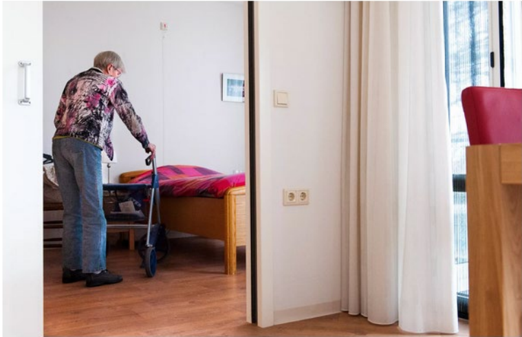
Beleid van het kabinet-Rutte III heeft het houdbaarheidssaldo van de overheid verslechterd, stelt het CPB.