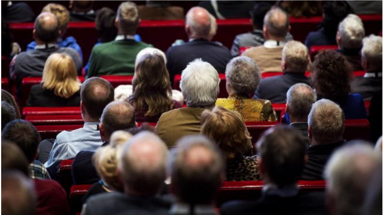
Bezoekers Inspiratieplusdagen voor 55-plussers in Utrecht.